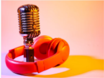
Bilinguisme - 20 podcasts en français pour enfants et adolescents 20 podcasts en français pour enfants et adolescents. Une large sélection sur des thèmes variés, à partir de

Pour nos élèves FLAM et afin qu'ils gardent un niveau natif, la fédération FLAM USA recommande une exposition à la langue française d'environ 20 heures par semaine. Voici quelques outils pour vous aider dans cette mission.